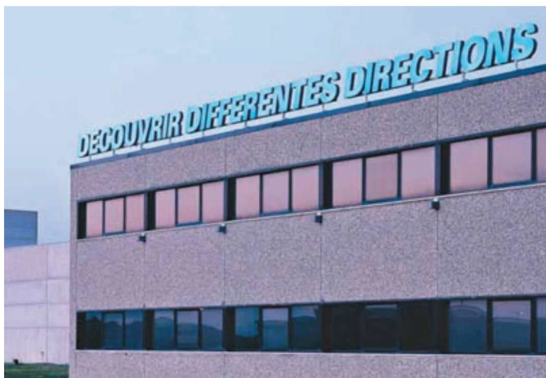
Maurizio Nannucci, Decouvrir differentes directions, 2001. cm 70x20000. Stabilimento Teseco Pal. Direzionale, estero. Foto Ela Bialkowska (particolare).

Se il collezionista ha modo di progettare nel tempo una strategia di acquisizione, una tattica di distribuzione spaziale, il curatore che si prende briga di concentrare nello spazio e nel tempo questo organismo complesso, quasi irretito entro i confini di un pensiero selvaggio, non ha a disposizione che stru-