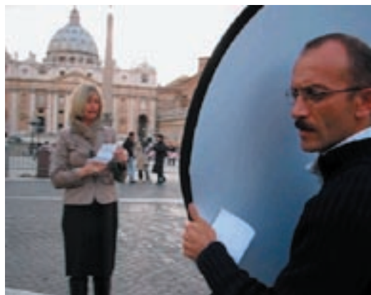
Stefania Galegati, "Notes by Chance", 2005 still dal video

Il MAN presenta la mostra Modern Times, una rassegna video che oltrepassa i confini del museo per svolgersi anche lungo la strada pedonale della città e presso l'auditorium della Biblioteca Satta, nella convinzione che l'azione di un museo non sia mai costretta dentro il suo perimetro ma si proietti sempre e comunque all'esterno. Nel movimento intra e extra muros si compie quell'oscillazione che ci auguriamo dimostri che il linguaggio contemporaneo, e più che mai quello delle immagini in movimento, ha assunto, nel nostro tempo, un ruolo preminente.