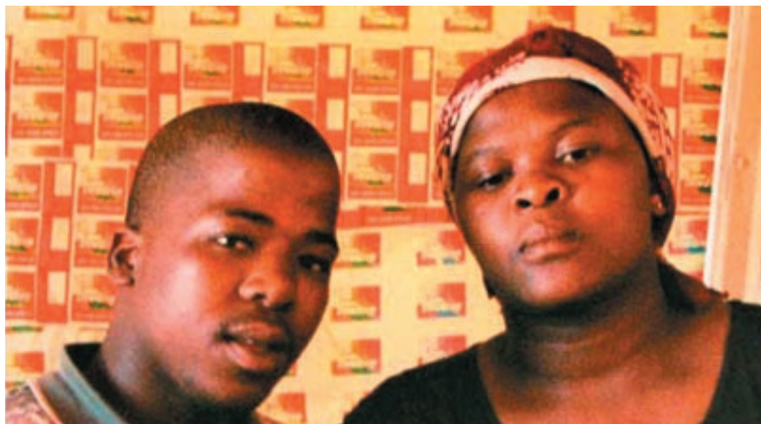
Zwelethu Mthethwa, Untitled, 1998.