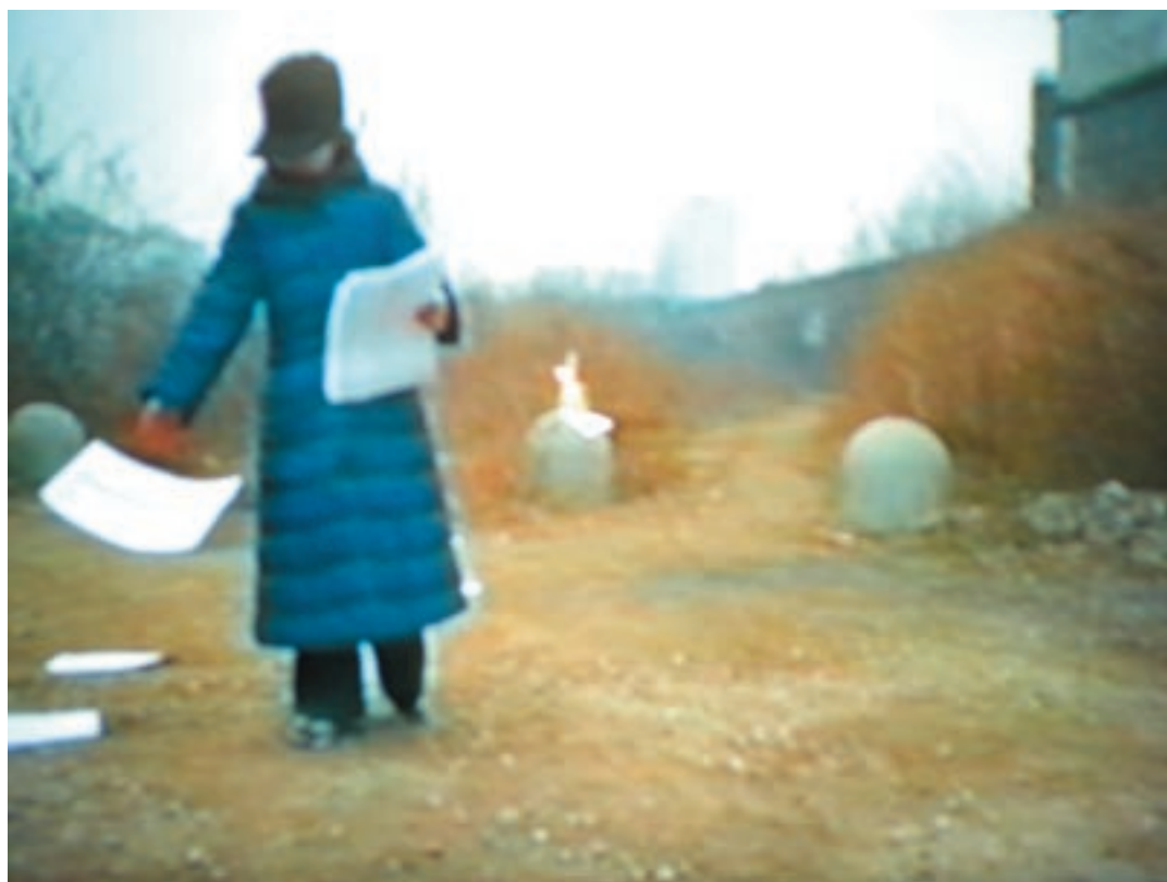
Botto e Bruno, Without you I'm nothing, 2000. Video betacam, 6'. Ed. 1/5.

parte di quel meccanismo che fa parlare le opere. Si colgono nuovi aspetti, si intravedono sfumature, si moltiplicano le associazioni, si esaltano alcuni tratti, se ne deprimono inevitabilmente degli altri. Il nostro invito ha visto l'ospitalità offerta ricambiata con grande generosità dalla Fondazione Teseco, così il MAN presenta una nuova mostra mentre la Fondazione ri-scopre il suo prezioso tesoro. Nel terzo movimento, le regole di questo gioco funzionano, curiosamente, sia in presentiam che in absentiam ponendoci interessanti quesiti sul nostro presente e proiettando nuova luce sul prossimo futuro. E questo vale tanto per noi quanto per loro: nella nostra memoria vivono le collezioni momentaneamente assenti dai nostri rispettivi spazi. Questa dinamica di scambi è possibile grazie alla capacità di rinunciare a qualcosa per mettersi all'ascolto e rivolgere un nuovo sguardo, meno diffidente, sulla differenza, quella stessa che strenuamente difendiamo e che fonda la nostra continua rivendicazione individuale e identitaria. Non è la prima volta e non sarà l'ultima. BYO è una sorta di motto, un invito e insieme una certezza: al MAN "ciascuno può portare qualcosa di suo" non solo da mettere al centro ma soprattutto da condividere.