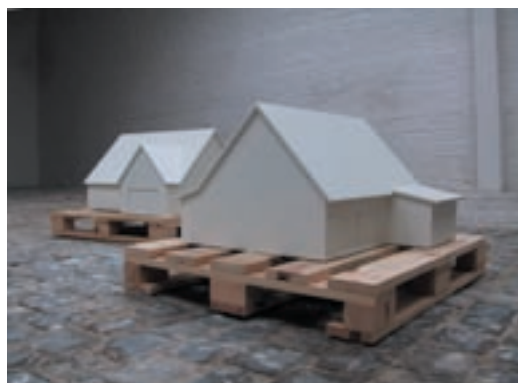
Ward Denys, “5 Fermettes”, 2004. Installazione

Nelle terre di frontiera, infatti, si assiste a due fenomeni opposti, ma ugualmente deleteri. Da un lato c'è chi, per conto di una tradizione culturale non meglio precisata, è del tutto contrario all'arte contemporanea perché in buona sostanza è contrario alla stessa contemporaneità e al presente, da cui si sente irrimediabilmente emarginato o escluso. D'altro lato c'è chi cerca invece di adeguarsi ai dettami che provengono dai centri dell'impero importando, nel