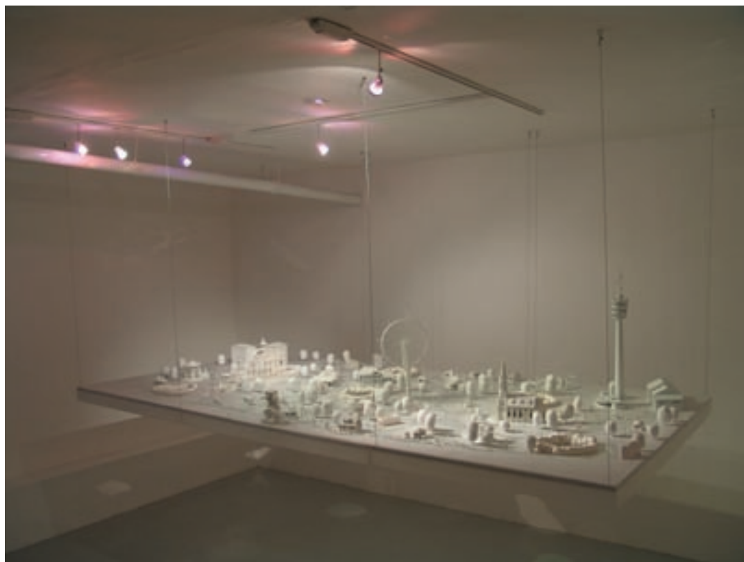
Dragana Sapanjoš, "POMeCA", 2005. Installazione.

Scopo principale della rassegna è di dar conto di alcune forme della sperimentazione contemporanea mettendo in contatto le più significative espressioni artistiche di questa regione di confine con l'ambito nazionale e internazionale. Tale obiettivo è perseguito senza alcuna connotazione localistica, bensì nella convinzione che la crescita culturale debba passare necessariamente attraverso l'apertura e il confronto, tanto più che molte espressioni contemporanee del Nord Est possono ormai essere poste sullo stesso piano di quelle elaborate nel resto d'Italia e all'estero. Localizzare per significare, localizzare per non cadere nelle trappole della generalizzazione: questo in fondo l'obiettivo di HICETNUNC, una rassegna il cui metodo consiste prin-