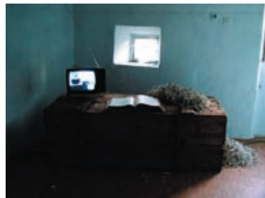
Tomislav Brajnović, "Munejna hiza / Casa matta", 2004. Installazione.

HICETNUNC propone quest'anno 30 mostre e una decina di eventi (concerti, conferenze, rappresentazioni teatrali); circa 60 sono gli artisti partecipanti, italiani e stranieri: più precisamente saranno esposte opere provenienti da Corea del Sud, Croazia, Belgio, Germania, Israele, Italia, Portogallo, Porto Rico, Romania, Slovenia, Spagna, Stati Uniti e Svezia.