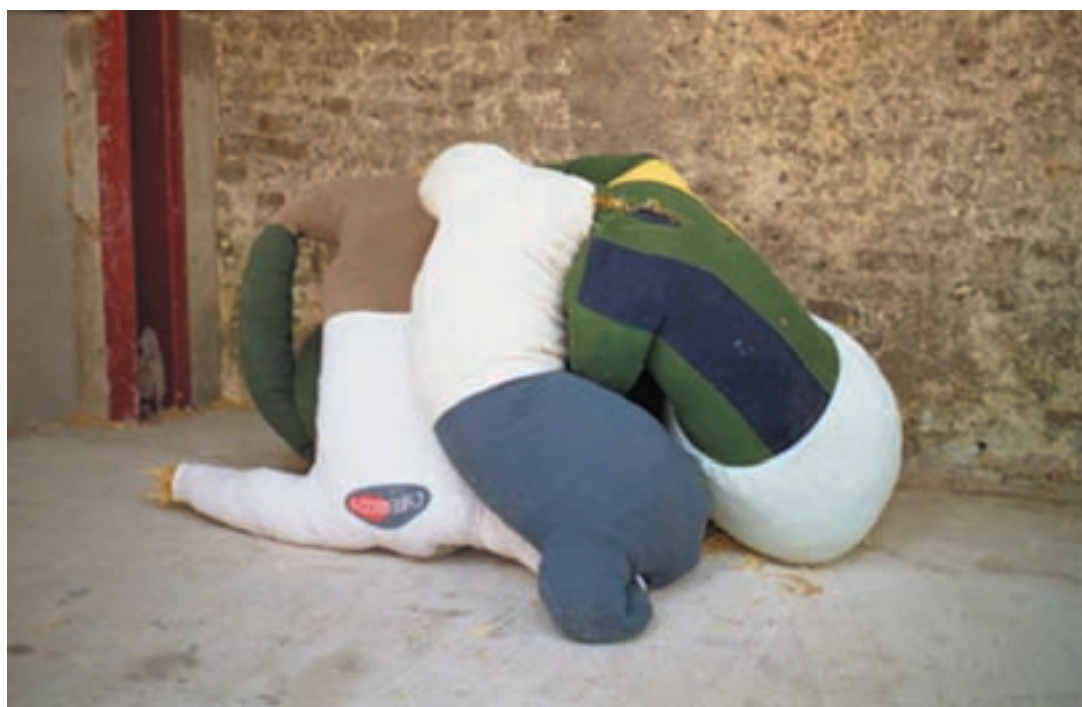
Sophie Usunier. Les empaillés. Installazione, 2003

Con le sue installazioni l'artista francese esprime grande delicatezza e poesia che rimandano ad un mondo da riscoprire. Semplici all'apparenza i suoi progetti testimoniano una trasformazione che inizia con una rielaborazione dai meccanismi che sorreggono e definiscono il volto noto del mondo lavorando sulla stabilità dei concetti che regolano i rapporti e l'identità delle cose, fornendogli poi una riqualificazione attraverso uno sguardo innocente, mezzo per scavalcare le convenzioni, per giungere ad una nuova forma che sia come una nuova origine. Un viaggio a ritroso attraverso la memoria.