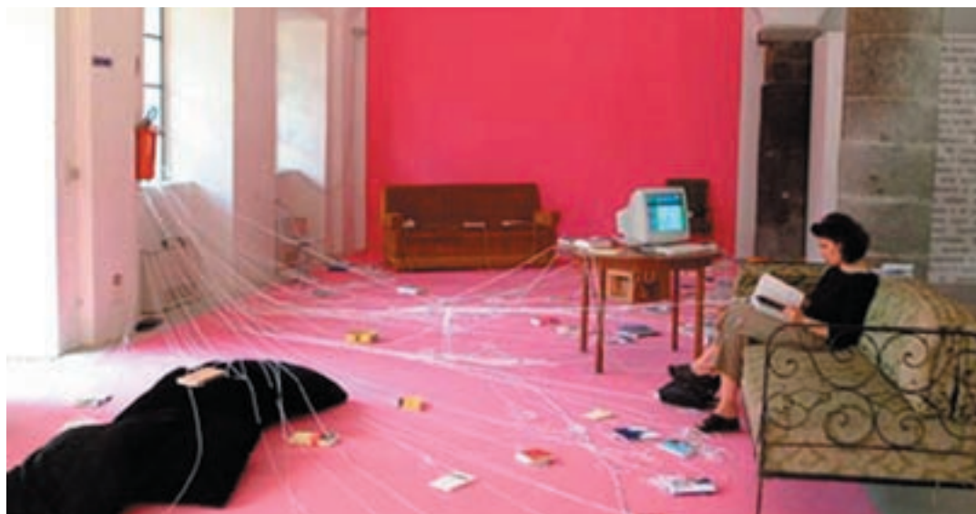
A 12 per Arte al Centro - Cittadellarte Fondazione Pistoletto

Il progetto si pone dunque come un laboratorio interculturale dove uomini e donne di culture, nazionalità, religioni, professionalità e ceti sociali diversi si confrontano in uno spazio di dialogo dove la soggettività all'interno di ogni cultura può esprimere tutta la sua forza trasformatrice. Il laboratorio intende valorizzare le differenze tra una cultura e l'altra, ma anche far emergere somiglianze, comunanze, mescolanze pregresse, trasformazioni reciproche in atto. E' un metodo che accende il confronto, facilita l'analisi reciproca e offre punti di approdo metaculturali. La cultura è qualcosa di molto più complesso delle stereotipate caratteristiche che apprendiamo dalla TV o insegniamo a scuola. Il laboratorio vuole tentare di leggere questa complessità attraverso l'emersione delle caratteristiche della cultura ufficiale, ma anche delle subculture (o "culture minoritarie", o "culture alternative", o "culture di resistenza" che dir si voglia) che la società