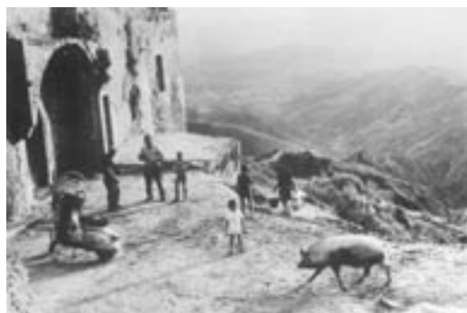
H. Cartier Bresson. Masseria del materano, 1972. courtesy Comune di Tricarico

Ad un anno dalla scomparsa del Maestro, la Fondazione SouthHeritage rende omaggio al grande fotografo e al suo linguaggio artistico-antropologico inteso come impegno di documentazione verso aspetti della realtà storico-sociale lucana. In questa prospettiva il progetto è finalizzato non solo alla valorizzazione della cultura dell'arte contemporanea ma anche alla rivalutazione delle collezioni presenti sul territorio e a facilitare la realizzazione delle condizioni strutturali che possono stimolare lo sviluppo della produzione, della creazione, della ricerca artistica