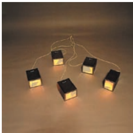
Sophie Usunier. La capture 1,2,3,4,5. installazione 2001

Attraverso la Fondazione si è dato vita a un programma culturale come osservatorio