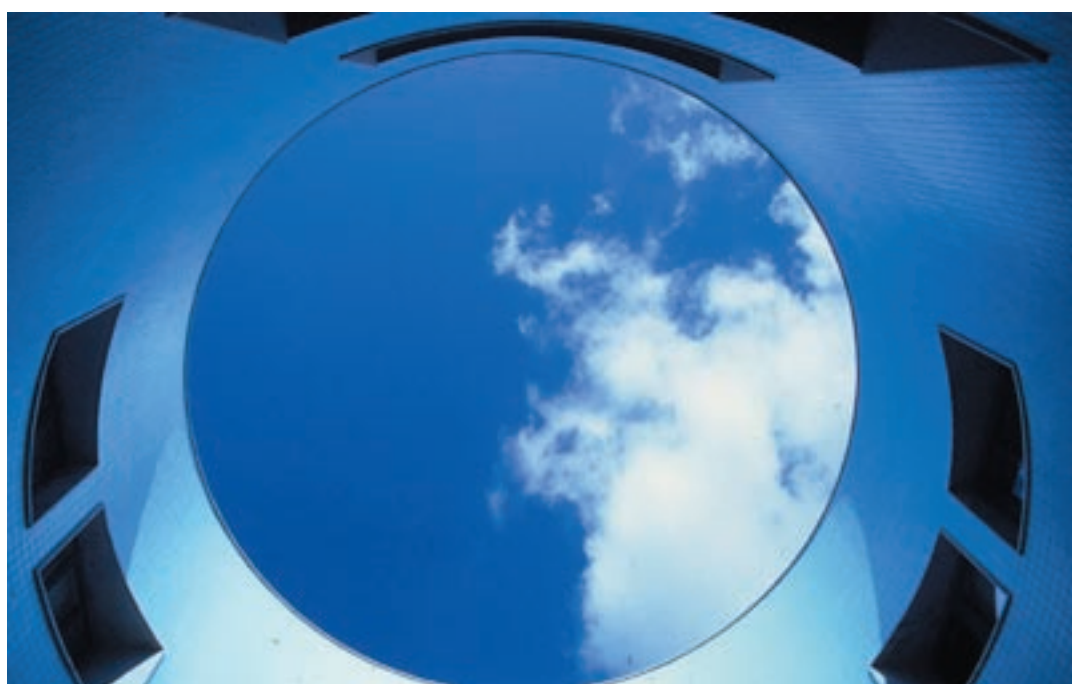
Carlo Aymonino + Piergiorgio Corazza + Raffaele Panella . Piazza Mulino / Matera, 1987 # 1.

La ricerca è intesa come strumento per la costituzione di una piattaforma di discussione sul