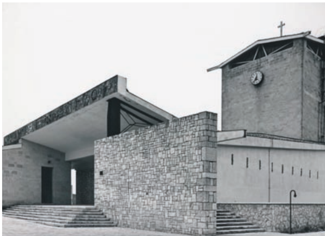
Ludovico Quaroni. Chiesa di S. Vincenzo - La Martella / Matera, 1951.

Dopo il convegno nazionale ARTE A SUD: verso un modello per il contemporaneo (che ha visto la partecipazione di numerose personalità del mondo artistico nazionale), la Fondazione ha inaugurato la Project Room Next Heritage che interviene a supporto della creatività delle nuove generazioni. Obiettivo primario è dunque lavorare con artisti italiani emergenti proponendo un programma ricco e una selezione di