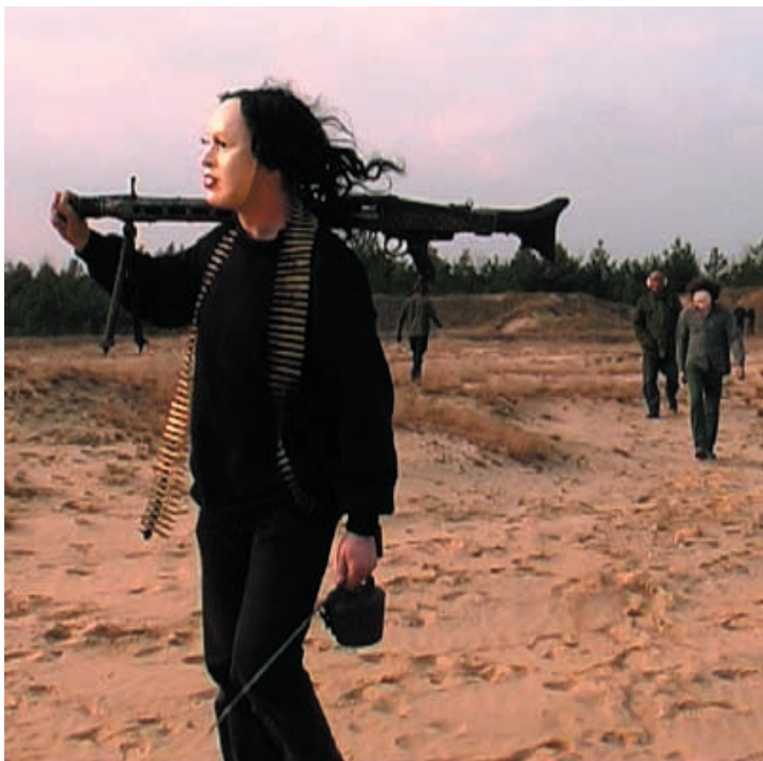
Punishment and Crime. Video installation, 2002

D'altra parte, sia che ritragga se stessa come un'Olympia affetta dal cancro (Olympia, 1996), sia che metta in posa la sorella sullo sfondo di una gigantesca