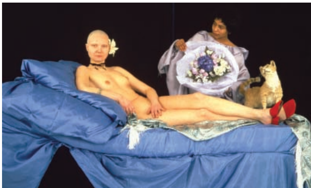
The Olympia. Installation, 1996