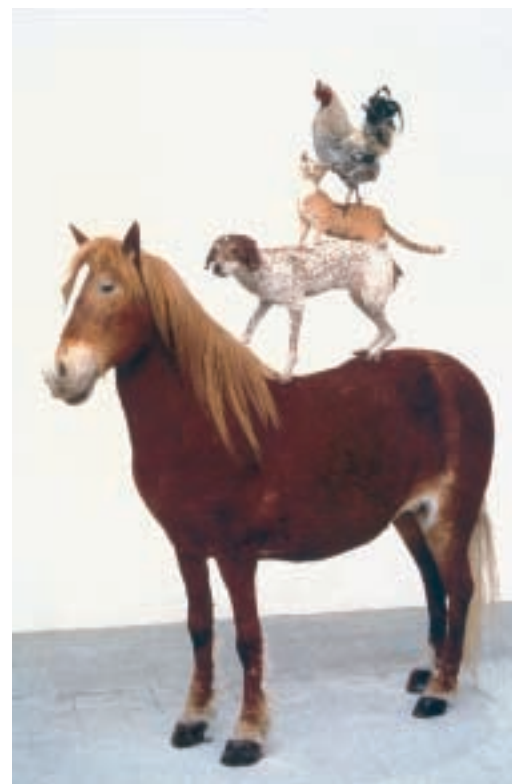
Pyramid of Animals. Life-size sculpture, video, 1993

La gente trucida gli animali, è normale, viene fatto di continuo. Visto