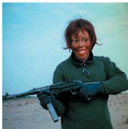
Punishment and Crime. Video installation, 2002

Difficile dire quale sia la punizione che l'artista ha riservato ai protagonisti della sua videoinstallazione. Eppure in uno dei monitor i personaggi mascherati ci appaiono con un cappio al collo, appesi ai rami di un albero, come vittime di un linciaggio: naturalmente si tratta di una semplice simulazione - l'ennesimo gioco di gruppo, che nella tribù trova anche il coraggio per ridere in faccia alla morte.