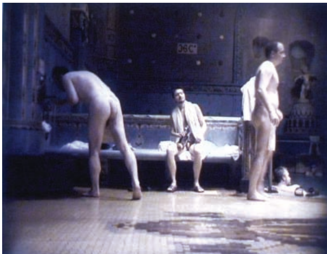
Men's bathhouse. Video installation, 1999